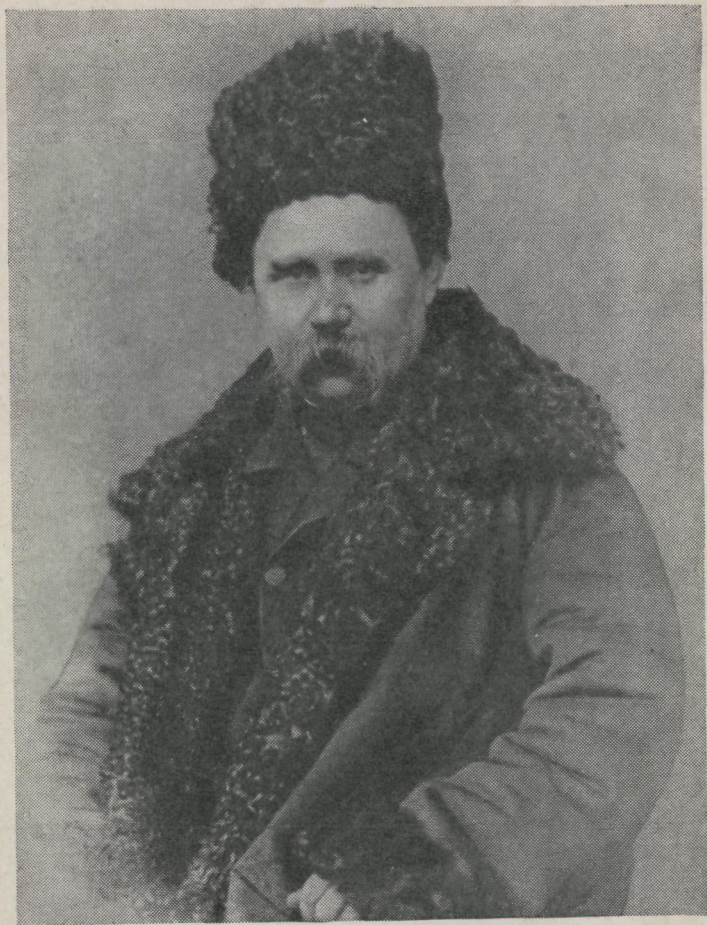
Т. Г. Шевченко. Фото.